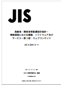
JIS X 8341-3:2010