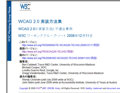
WCAG 2.0 実装方法集